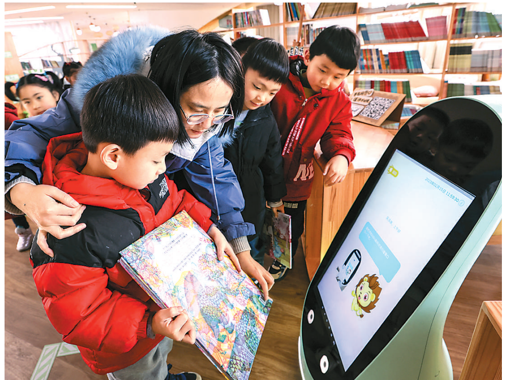
江苏省常州市新北区龙虎塘街道中心幼儿园(盘龙新区)依托当地智能传感特色产业的科技力量,设计建造了“智慧趣”校园,孩子们可以在教室、活动室、阅览室等场所体验到科技的智能乐趣。图为老师在指导小朋友通过“人脸识别+语音互动”的云上借阅系统借阅图书。

为了支持、规范行业发展,国家有关部门出台了《信息安全技术 人脸识别数据安全要求》等政策。与此同时,社会力量在积极推进人脸识别技术的合规使用。例如,中国信息通信研究院云计算与大数据研究所发起“可信人脸应用守护计划”,联合多家企业、法律机构和学术团体,共同推动人脸识别行业合规发展。专家认为,人脸识别技术在众多应用场景中让用户受益,既要推动其不断创新进步,也要把人脸信息的安全放在重要位置。