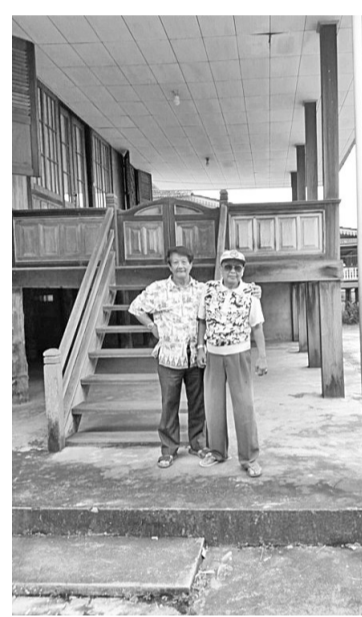
作者(左)与伯哈夷在高脚屋前合影

高脚屋上的主人见是相识的赛福尔，就招呼我们上去，到得上面一看，前庭楼板是清一色灰黑的铁木板铺成。主人是位有年纪穿着沙笼的哈