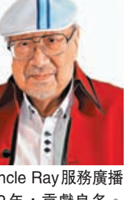
Uncle Ray 服務廣播界72年，貢獻良多。

「樂壇教父」Uncle Ray的喪禮於2月23日星期四舉行，下午4時至6時是Uncle指定的公祭時段，可見他對Fans是何等的重視和珍惜！實在，Uncle服務廣播界72年，他對樂壇的貢獻、他的DJ神功、樂於助人、扶掖後輩的精神，我輩得衷心致敬和緊緊追隨！Uncle Ray一路好走，感恩有你！