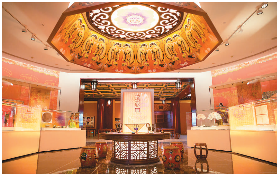
▲“琼戏台——琼州表演艺术陈列”。