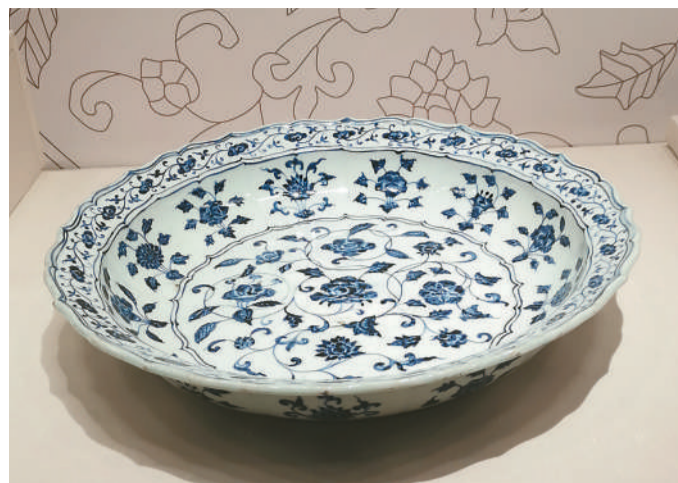
▲明永乐青花缠枝牡丹菱口瓷盆。