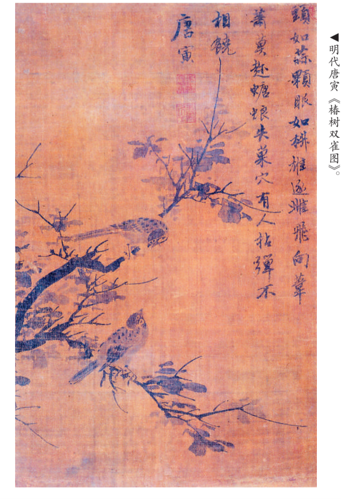
▲明代唐寅《椿树双雀图》。

据悉，今年苏州湾博物馆将端出一桌文化盛宴，包括三大系列精品展：展示大国珍宝的“国宝争门”系列，演绎江南文化的“平行江南”系列，凸显吴江馆藏精品的“博雅吴江”系列。同时还将启动一系列品牌社教课程，包括探寻吴江前世今生的“吴地风韵”主题，探索吴江丝绸故事的“江南丝韵”主题，走近吴江风流人物的“博学雅韵”主题等。