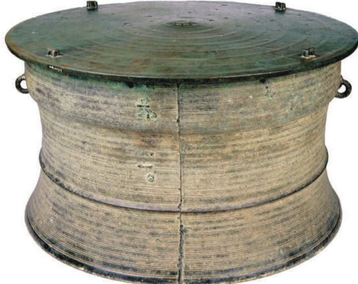
▲汉代北流型四蛙云雷纹铜鼓。