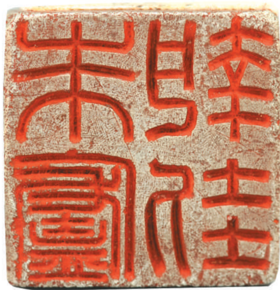
▲汉代“朱庐执判”银印。