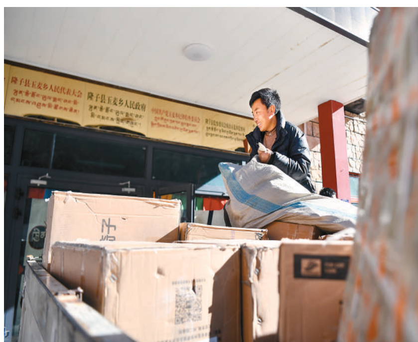
▲ 玉麦乡邮递员在搬运刚刚抵达玉麦的快递包裹。