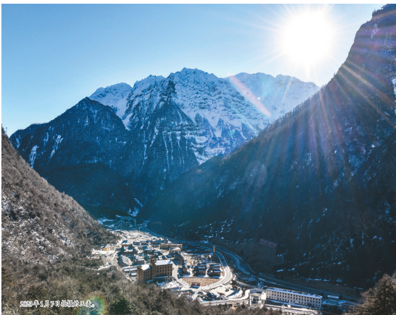
2023年1月7日拍摄的玉麦。