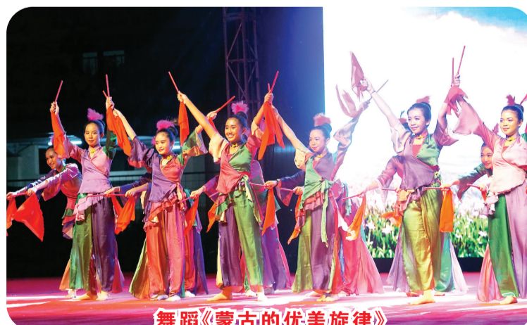
舞蹈《蒙古的优美旋律》