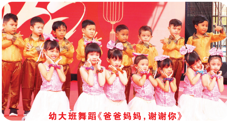
幼大班舞蹈《爸爸妈妈，谢谢你》