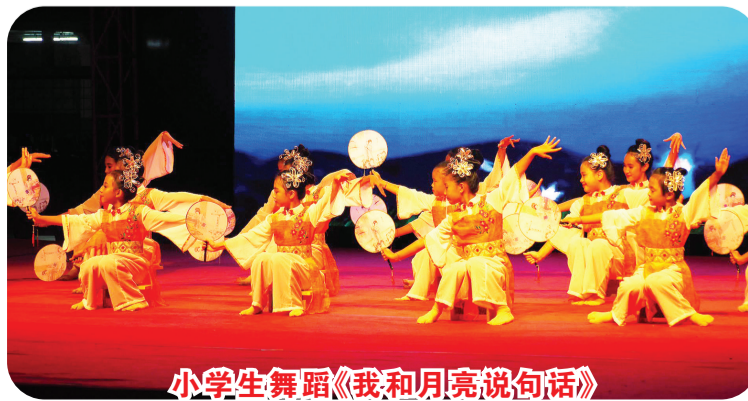
小学生舞蹈《我和月亮说句话》