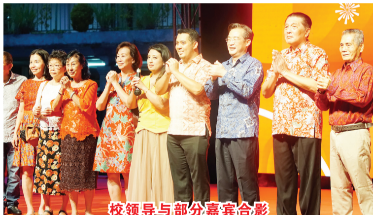
校领导与部分嘉宾合影