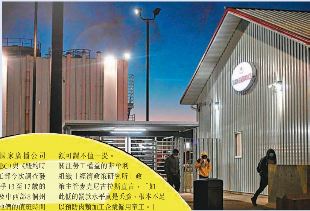
◆8個州份共13個肉類加工廠涉非法僱用童工。

美國勞工部17日宣布，當地最大的食品安全衛生服務商之一「包裝工衛生服務公司」(PSSI)僱用至少102名童工，在肉類加工廠從事高危工作，最年幼者僅有13歲。他們需使用大量危險設備，更有童工因接觸腐蝕性清潔劑被灼傷皮膚。PSSI被裁定只需支付150萬美元罰款，多名勞工權益專家直言嚴重的僱用童工違法行為沒有遭到嚴格處罰，根本不足以阻止僱主違規，美國童工問題只會愈演愈烈。