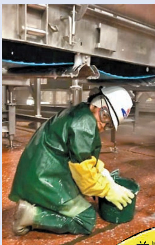
◆涉事肉類加工廠內有疑似童工進行清潔。

美國勞工部17日宣布，當地最大的食品安全衛生服務商之一「包裝工衛生服務公司」(PSSI)僱用至少102名童工，在肉類加工廠從事高危工作，最年幼者僅有13歲。他們需使用大量危險設備，更有童工因接觸腐蝕性清潔劑被灼傷皮膚。PSSI被裁定只需支付150萬美元罰款，多名勞工權益專家直言嚴重的僱用童工違法行為沒有遭到嚴格處罰，根本不足以阻止僱主違規，美國童工問題只會愈演愈烈。