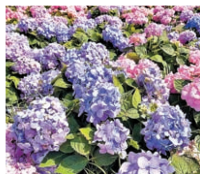
◆今年花卉展覽的主題花是繡球花。

園林造景。會場亦設有售賣花卉及園藝產品的銷售攤位。大會在展覽期間同時舉辦多項教育與娛樂並重的活動，適合一家大小參與。