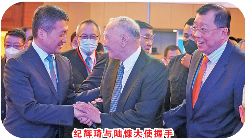
纪辉琦与陆慷大使握手