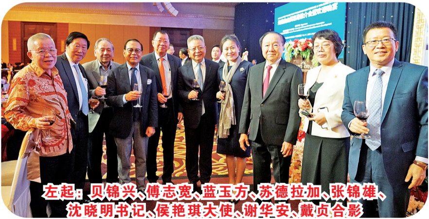
左起:贝锦兴、傅志宽、蓝玉方、苏德拉加、张锦雄、沈晓明书记、侯艳琪大使、谢华安、戴贞合影