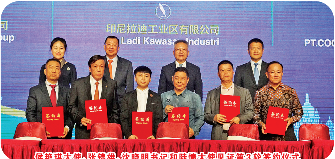
侯艳琪大使、张锦雄、沈晓明书记和陆慷大使见证第3轮签约仪式