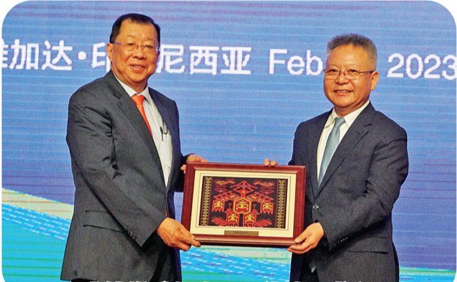
张锦雄赠纪念品予沈晓明书记

省政府携手,共同推动双方经贸合作,为共建一带一路,繁荣印尼、海南经济,做出积极贡献。”