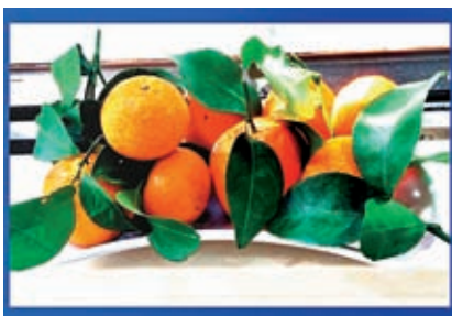
◆意頭好/味道好/果中之寶。

一日色變，兩日而味變，不單指荔枝，什麼水果亦如是，離開本土果園，吃出原味八成已十分難得。多年沒吃過橘子，年晚時買來的大橙不如理想，看到超級市場門口擺放的大桔枝葉茂盛，皮色光潤，姑且買來一試，果如推介字牌所說清甜無核，意外驚喜之餘，還滿有回到家鄉的感覺呢。