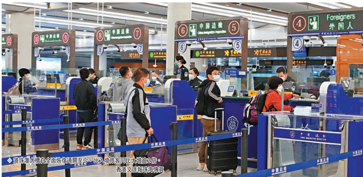
港珠澳大橋自全面恢復通關至今，出入境旅客同比大增逾2倍。

香港文匯報訊（記者 方俊明 珠海報道）自2月6日內地與港澳人員往來全面恢復以來，粵港澳大灣區居民旅遊互訪的熱度不斷上升，推動港珠澳大橋珠海口岸出入境客流、車流持續高位運行。據港珠澳大橋邊檢站統計，截至2月15日零時，該站共查驗出入境旅客近20萬人次，車輛超6萬輛次，同比大幅增長217%和76%。春節「返鄉潮」疊加「旅遊熱」，帶來人氣復旺，市場向好，折射出灣區發展活力。