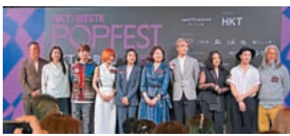
「HKT西九音樂節」將於下月22日起一連10天在西九龍文化區舉行。圖為傳媒發布會。

同時M+大台階將在4月1日及2日化身表演舞台，播放動漫藝術家江康泉的創作，同時亦有自由空間樂團的現場演出。西九會藉機邀請全球媒體到訪，希望藉多個文化藝術界的重量級人物訪港時，一併介紹西九，相信能吸引各地人士。