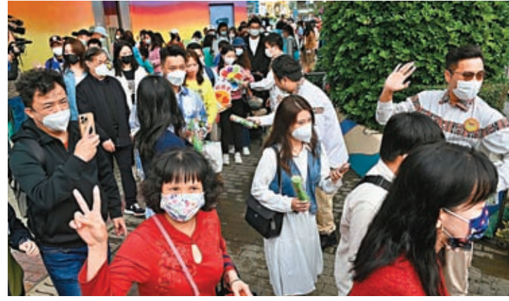
今年1月有近50萬人次的旅客訪港。圖為內地旅行團進入香港海洋公園遊玩。資料圖片

旅遊促進會總幹事崔定邦認為，香港要吸引更多旅客到港，使行業復甦，就要正視接待力的問題，確保能為旅客提供優質和完整的旅遊體驗。