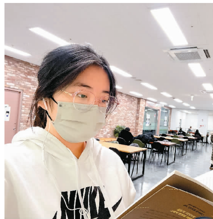
作者在成均馆大学图书馆内阅读。