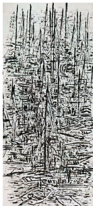
南海渔港之一（中国画）崔振宽