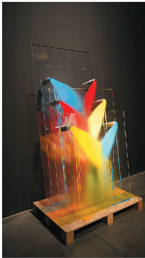
王恩来作品《释压玻璃板》。