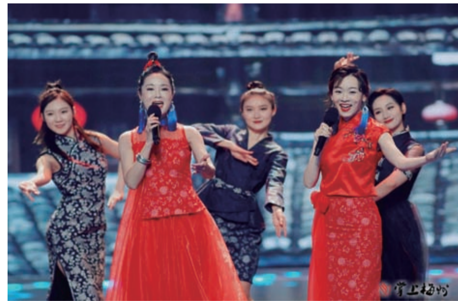
圖為鐘雯（左二）在表演節目。

（掌上梅州訊）2月5日晚，“免氣揚眉慶新年 灣區同心共圓夢——2023粵港澳臺青年元宵晚會”在廣東廣播電視臺舉辦。晚會同時，在國內外多個網絡、電視、廣播、報刊融媒等平臺播出，引起了海內外熱烈反響。梅州籍知名歌手、全球客家形象大使、梅州市政協委員鐘雯與祖籍梅州蕉嶺明星、2001年香港小姐選美冠軍楊思琦化身一對“姐妹花”，身着客家服飾，聯袂獻唱一曲《丫屋系客家妹》將客家文化重要元素中的客家女性勤勞聰慧的一面展現出來，向全世界客家人傳遞濃鬱的家鄉情結。