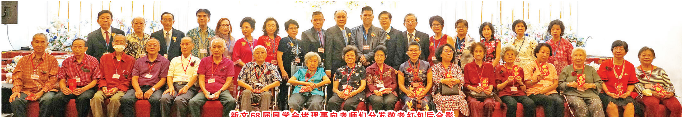
新文68届同学会诸理事向老师们分发敬老红包后合影