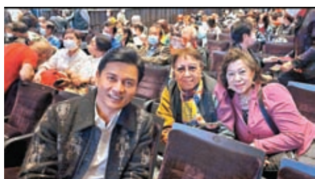
◆在戲曲中心遇到魅力十足的呂良偉！

咱們看了那麼多戲曲表演，還有另外一個好機會，老同學和我遇到心儀的昆劇大師裴艷玲帶徒弟東西九演出，儘管她只是研討會的主講，但我們仍樂於聽聽她豐富的教人神迷的演出經驗！