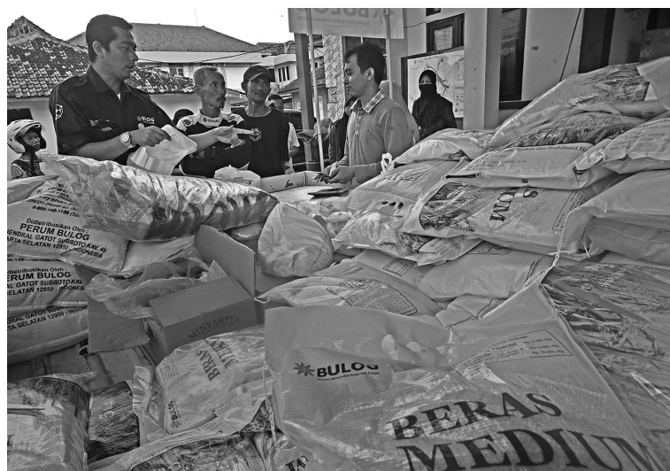
粮储局展开市场干预行动稳定米价 2月15日,粮储公共公司展开市场干预行动,中等质量大米售价每公斤9450盾,优质大米每公斤卖12800盾。

总额为3968亿美元中,共有21个国家或地区提供的贷款共2058亿美元。引述自央行于2月14日发出的资料,我国十大债权人如下:(1)新加坡提供借贷593.8亿美元,(2)美国333.4亿美元,(3)日本243.1亿美元,(4)中国大陆203.5亿美元,(5)香港175.7亿美元,(6)韩国63.1亿美元,(7)其它亚洲国家共106.4亿美元,(8)德国52.5亿美元,(9)荷兰48.6亿美元,(10)其它欧美国家共44.8亿美元。(Ing)