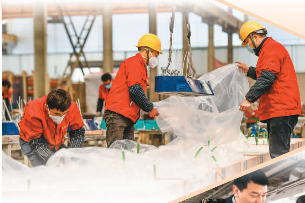
►新春伊始，安徽芜湖海关迅速启动“关助2023”专项行动，深入外贸企业开展全程通关服务和指导，助力芜湖外贸企业铆足干劲抓生产、抢进度，奋力夺取出口“开门红”。图为日前，芜湖海关关员在辖区内的奇瑞控股集团开展全程通关服务和指导。

►江西省丰城市持续推动外贸外贸企业稳运行、扩规模，加大企业培训力度，上门帮扶指导，推动企业拓展贸易渠道，促进外贸保稳提质。图为丰城市江西华伍制动器股份有限公司的员工在生产车间赶制销往欧洲市场的制动器产品。