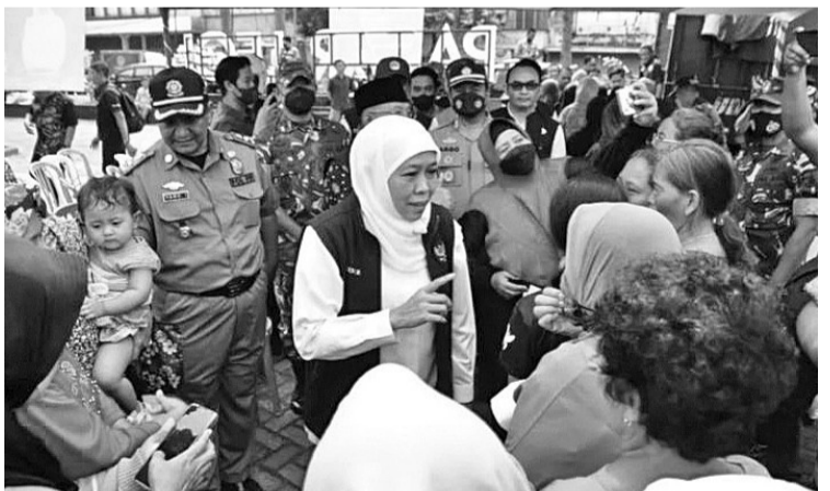
东爪哇省长干预市场稳定米价 为稳定米价,东爪哇省长科菲花(Khofifah Indar Parawansa)在勿里达市Legi传统市场展开市场干预行动。

与此同时,三宝壟-巴唐的第一期输气管道项目仍然持续施工,接下来又持续去做井里汶-三宝壟的第二期输气管道项目,并预定今年次季度末或第三季度初,三宝壟-巴唐的输气管道能够竣工。(Sm)