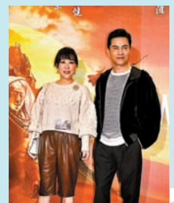
◆呂良偉9日偕同太太出席首映禮。