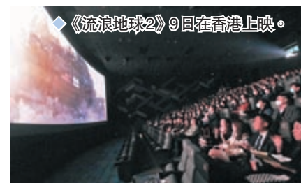
◆《流浪地球2》9日在香港上映。