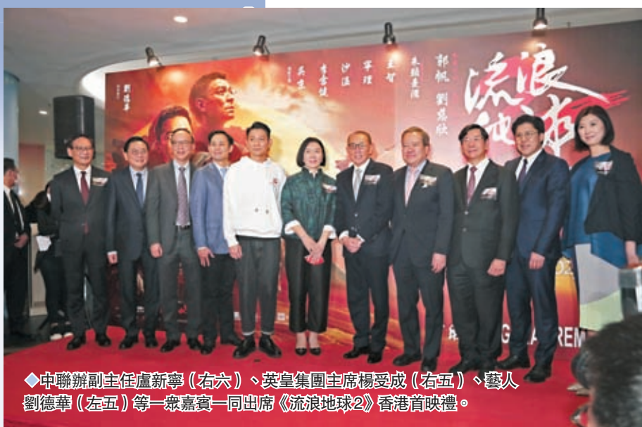
◆中聯辦副主任盧新寧（右六）、英皇集團主席楊受成（右五）、藝人劉德華（左五）等一眾嘉賓一同出席《流浪地球2》香港首映禮。

香港文匯報訊（記者 子棠、梁靜儀）劉德華（華仔）特別演出的科幻電影《流浪地球2》9日在港上映，並於當晚在銅鑼灣舉行盛大首映禮，吸引近百傳媒到場採訪及大批粉絲一早在現場等候，場面熱鬧。華仔表示樂於配合在港的謝票活動，又大讚戲中女兒將來可做演員，並樂意跟她一同參與《流浪地球3》的演出。