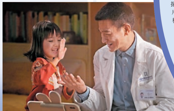
◆華仔大讚戲中女兒是演戲的材料。

華仔受訪時被問到對於影片在內地票房收35億元人民幣，成績斐然。他坦言感到很开心，看看票房可以再衝到多高。對香港票房是否有信心？他說：「希望大家喜歡這部戲。」近期香港都流行謝票活動，問到華仔會否參與？他表示會視乎老闆的安排，並會作出配合，而內地都有謝票活動，之後有機會他都想跟大家聚一聚。至於會否參與演出《流浪地球3》？華仔坦言知道有這個想法，如有安排都會參與。說到科幻片反應好，問到華仔會否繼續拍？他說：「香港科幻片產量不多，聽聞香港還有一部《天梯》，希望大家多注重這方面機會和經驗，都想再有機會拍，先等古天樂發展一下有什麼經驗。」他又透露未來有幾部電影會相繼在港上映，並會有新計劃。