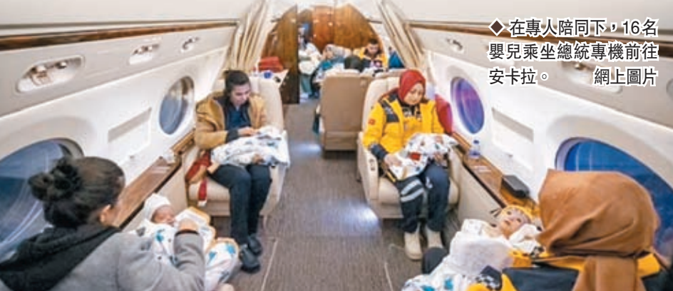
◆在專人陪同下，16名嬰兒乘坐總統專機前往安卡拉。

埃爾多安8日到卡赫拉曼馬拉什省進行視察，並發表講話。他受訪時承認政府對地震的初步反應存在問題，但反駁了部分批評聲音，表示情況「處於控制之下」，「這其中當然有缺失，但我們不可能為這如此重大的災難做好準備。」 ◆綜合報道