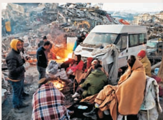
◆災民在廢墟旁生火取暖。