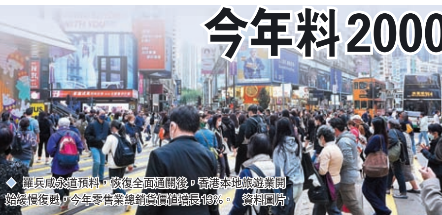
◆羅兵咸永道預測，恢復全面通關後，香港本地旅遊業開始緩慢復甦，今年零售業總銷貨價值增長13%。 資料圖片