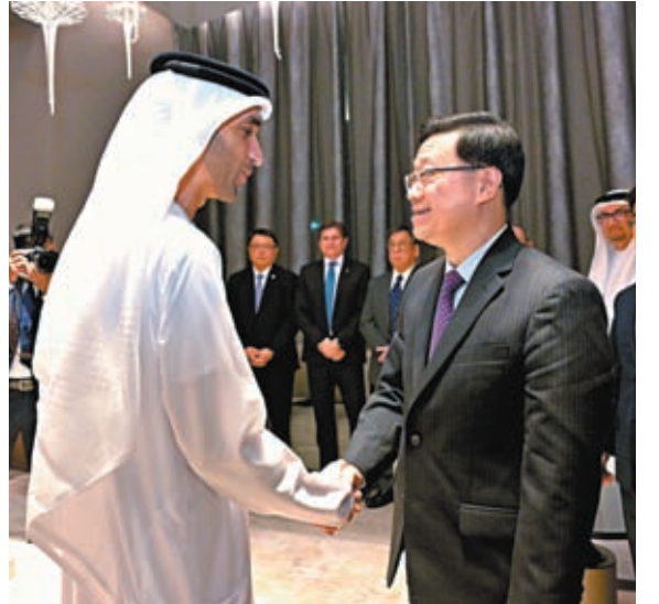
◆李家超9日在迪拜與阿聯酋經濟部外貿國務部長 Thani bin Ahmed Al Zeyoudi 會面。