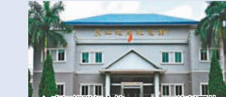
◆東江縱隊紀念館。資料圖片