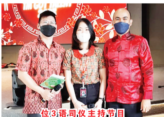
三位司仪主持节目