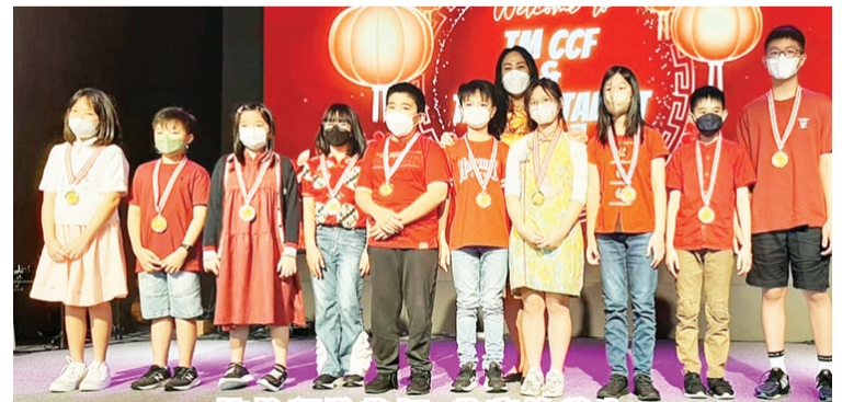
校长颁发奖杯、奖章给学生