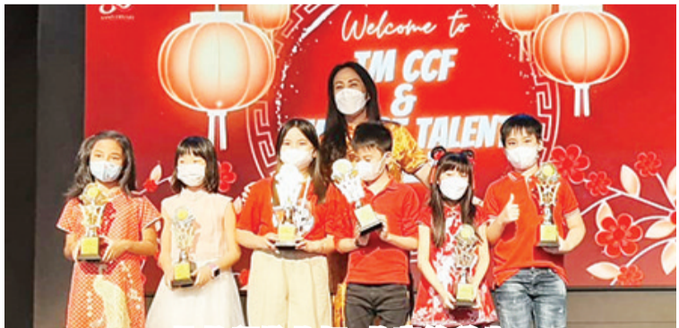
校长颁发奖杯、奖章给学生