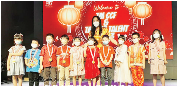
校长颁发奖杯、奖章给学生