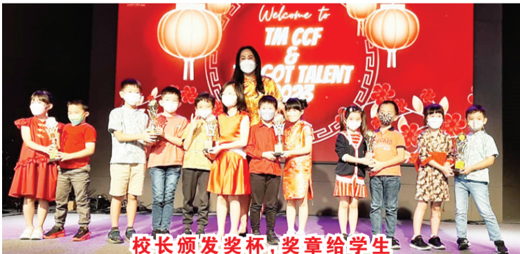
校长颁发奖杯、奖章给学生