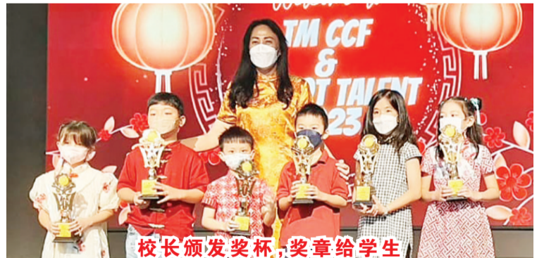
校长颁发奖杯、奖章给学生