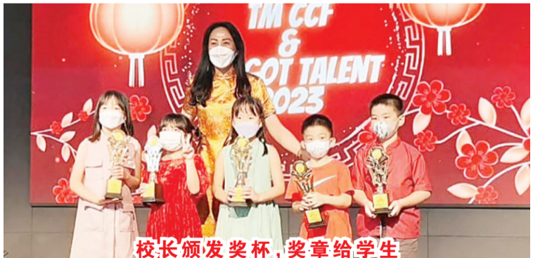
校长颁发奖杯、奖章给学生