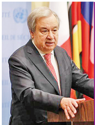
当地时间2月9日,联合国秘书长古特雷斯在纽约联合国总部表示,土耳其和叙利亚在遭遇强烈地震后伤亡人数不断增加,两国急需援助。他呼吁国际社会加大捐助支持,强调任何阻碍救援行动的制裁都不应存在。

中新社联合国电 联合国秘书长古特雷斯9日在纽约联合国总部表示,土耳其和叙利亚在遭遇强烈地震后伤亡人数不断增加,两国急需援助。他呼吁国际社会加大捐助支持,强调任何阻碍救援行动的制裁都不应存在。