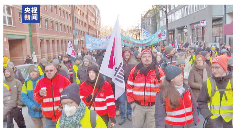
当天,上千名员工在柏林市中心聚集,要求政府积极帮助应对不断上涨的物价。

自俄乌冲突以来,德国通胀率急剧上升,2022年通胀率达到创纪录的7.9%,多地民众难以负担高昂的能源和食品费用。有抗议