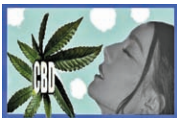
◆異香之草也迷人！

有關CBD的零食，本來歐美食品商人在包裝上亦有標註文字提醒，可是字體一般小如蠅頭，成年人粗心大意便容易一溜溜過，可見生人志在發財，明知加進食品的不是什麼好東西，不只故意縮細成分說明文字，還附印在不顯眼的隱蔽角落，表面上對法律已有交代，無非企圖混淆過關。 這類手法不僅見於大麻二酚之類零食，早在不同類型激素產品中已經流行，所以希望特區政府管制大麻二酚之餘，也能同時兼顧其它食品內容成分說明，當然也用不着香煙包上警句那麼嚇人，老煙民老眼朦朧，小煙民有恃青春無敵，煙霧迷蒙中視死如歸，才有必要大字警句，但是喜愛健康食品者全都愛惜生命，無不為自己和家人健康着想，大多自動合作接受忠告，說明文字也需要清晰。