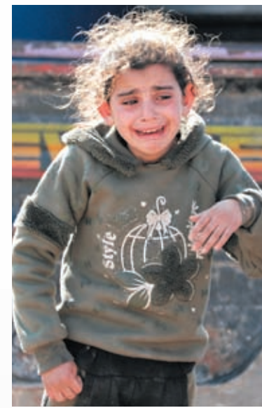
◆不少幼童承受巨大痛苦。

在敘利亞災區，一名少年的家園變成一片廢墟，他拍下這令人心酸的景象，影片中還不時傳出驚恐的尖叫声，「我不知道如何描述心中感受，還有兩至三個家庭被困，你能聽到他們的呼救。」聯合國兒童基金會發言人英格利希