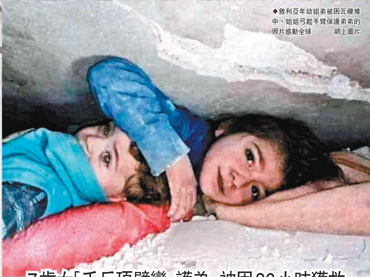
◆敘利亞年幼姐弟被困瓦礫堆中，姐姐弓起手臂保護弟弟的照片感動全球。網上圖片