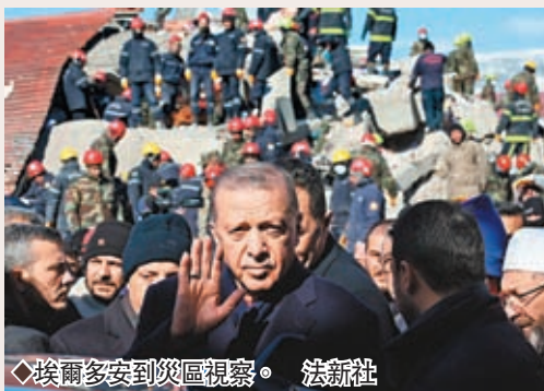
◆埃爾多安到災區視察。

土耳其將於5月份舉行總統及國會選舉，在近期通脹高企及本幣里拉急瀉下，對於已執政長達20年的總統埃爾多安而言，選舉面對前所未有的挑戰。今次世紀大地震造成傷亡慘重，仍有不少人被困瓦礫中，大量居民等待救助，埃爾多安政府對地震準備不足備受質疑。