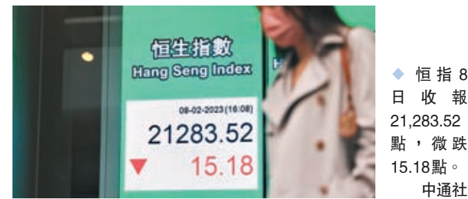
◆恒指 8 日收報 21,283.52 點，微跌 15.18 點。

信達國際研究部董事趙曉文表示，大市持續反覆，但恒指自高位已回落了一定幅度，從大市目前氣氛來看，大市短期內未必出現深度調整，尤其是鮑威爾在表示美息仍有續升的可能後，市場也未見有太大反應，故暫時來看，大市若回調，相信在 1 月初遺留的上升裂口附近，即 20,800 至 21,000 點便會有所支持。耀才證券研究部總監羅輝稱，港股連續下跌，已累跌近 900 點，初步沽壓料已獲得釋放，投資者將繼續關注 A 股表現，以及中美關係。在缺乏更多的利好消息支持下，他預期，恒指短期或會下試 21,000 點的支持位。