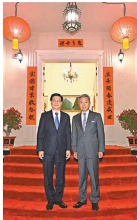
◆2月7日晚，李家超(左)出席張益明(右)所設的歡迎晚宴。

香港特區行政長官李家超8日上午繼續在阿聯酋阿布扎比的訪問行程，並於下午轉往阿聯酋迪拜進行訪問。他8日在社交平台表示，自己和代表團上午到阿布扎比的中阿產能合作示範園。示範園是國家與阿聯酋共建「一帶一路」的成功例子，展示出「一帶一路」合作的巨大潛力和意義。對有意在中東地區拓展業務的香港企業來說，這個示範園的營運模式和經驗具有很大參考和學習價值。他並強調，自己一直鼓勵香港企業利用境外經貿合作區作為切入點，在「一帶一路」相關國家拓展商機。