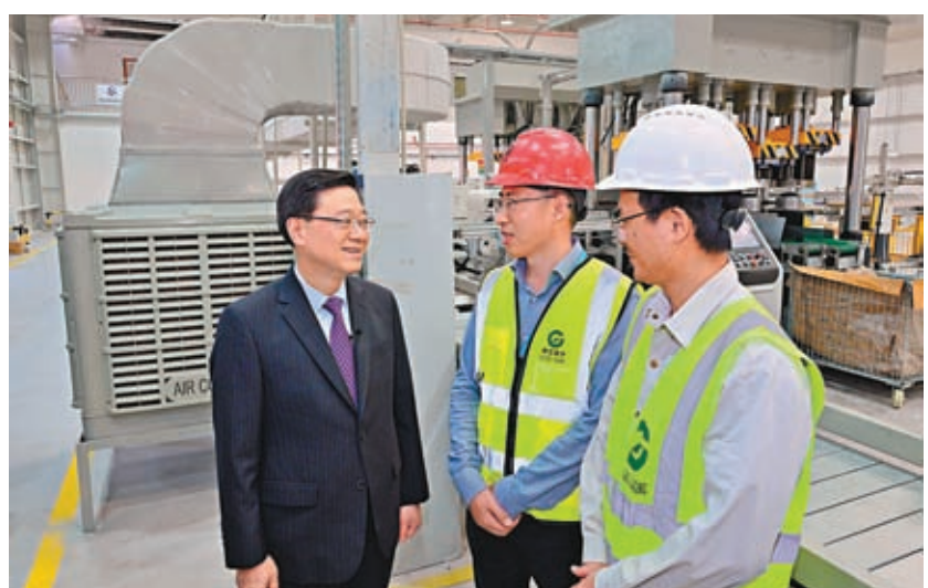
◆李家超與從內地來阿聯酋工作的工程師交流。