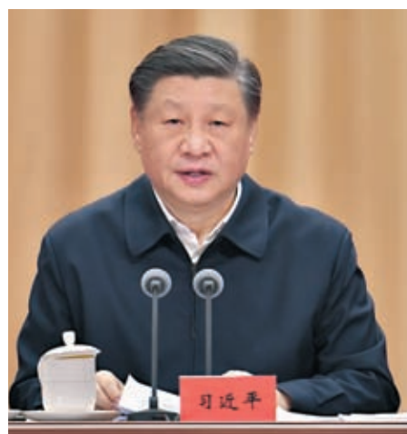
◆ 習近平在學習貫徹黨的二十大精神研討班開班式上發表重要講話。

習近平表示，新中國成立後，我們黨團結帶領人民進行社會主義革命，消滅在中國延續幾千年的封建制度，確立社會主義基本制度，實現了中華民族有史以來最為廣泛而深刻的社會變革，建立起獨立的比較完整的工業體系和國民經濟體系，社會主義革命和建設取得了獨創性理論成果和巨大成就，為現代化建設奠定根本政治前提和寶貴經驗、理論準備、物質基礎。改革開放和社會主義建設新時期，我們黨作出把黨和國家工作中心轉移到經濟建設上來、實行改革開放的歷史性決策，大力推進實踐基礎上的理論創新、制度創新、文化創新以及其他各方面創新，實行社會主義市場經濟體制，實現了從生產力相對落後的狀況到