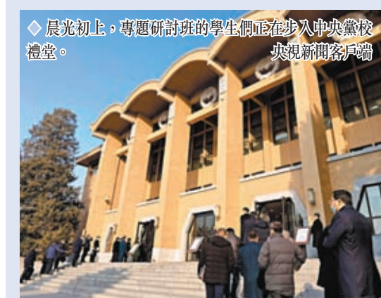
◆ 晨光初上，專題研討班的學生們正在步入中央黨校禮堂。