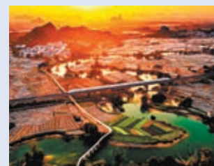
◆ 農曆春節期間，一輛高鐵列車駛過南寧隆安縣蔬果種植基地和新農村。網上圖片