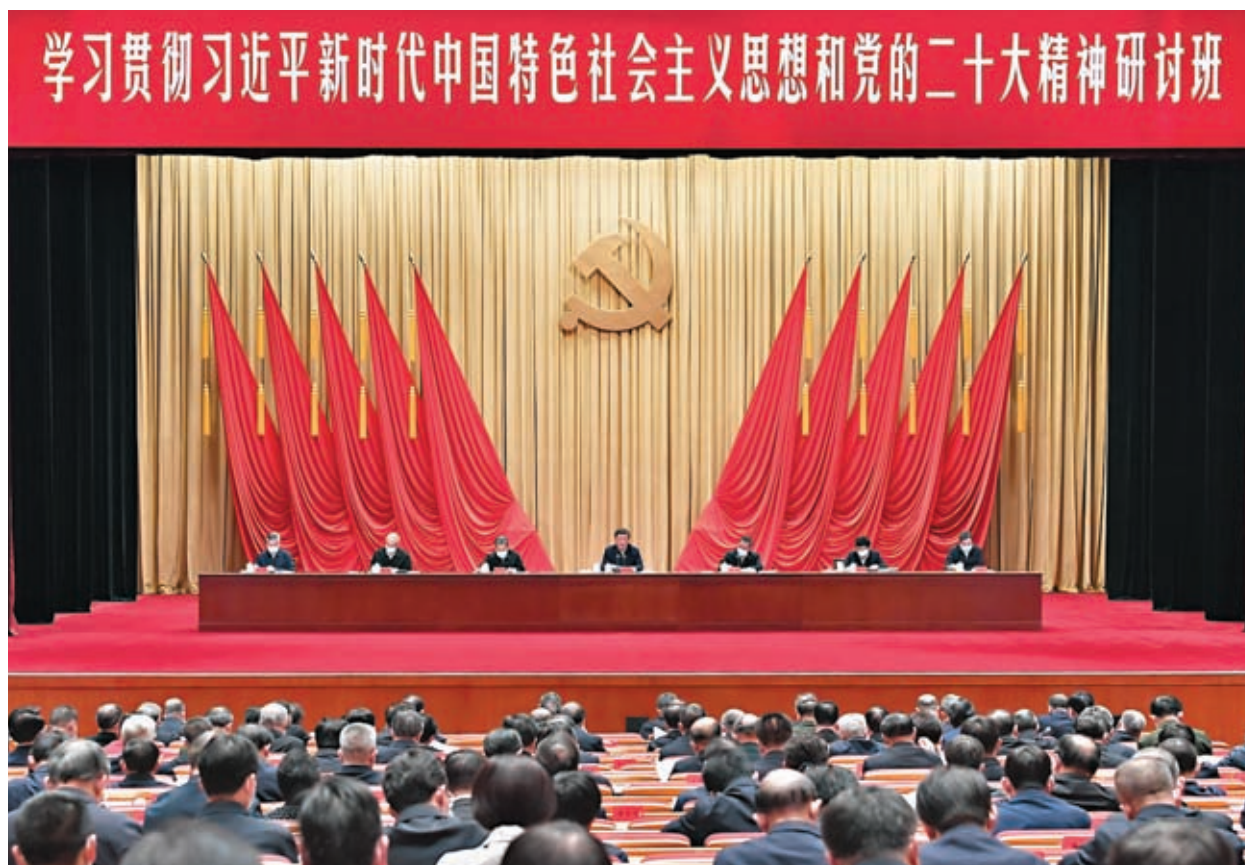
◆ 2月7日，新進中央委員會的委員、候補委員和省部級主要領導幹部學習貫徹習近平新時代中國特色社會主義思想和黨的二十大精神研討班在中央黨校（國家行政學院）開班。中共中央總書記、國家主席、中央軍委主席習近平在開班式上發表重要講話。李強、趙樂際、王滬寧、蔡奇、丁薛祥、李希等出席開班式。

習近平強調，黨的十八大以來，我們黨在已有基礎上繼續前進，不斷實現理論和實踐上的創新突破，成功推進和拓展了中國式現代化。我們在認識上不斷深化，創立了新時代中國特色社會主義思想，實現了馬克思主義中國化時代化新的飛躍，為中國式現代化提供了理論體系，使中國式現代化更加清晰、更加科學、更加可感可行。我們在戰略上不斷完善，深入實施科教興國戰略、人才強國戰略、鄉村振興戰略等一系列重大戰略，為中國式現代化提供堅實戰略支撐。我們在實踐上不斷豐富，推進一系列變革性實踐、實現一系列突破性進展，取得一系列標誌性成果，推動黨和國家事業取得歷史性成就、發生歷史性變革，特別是消除了絕對貧困問題，全面建成小康社會，為中國式現代化提供了更為完善的制度保證、更為堅實的物質基礎、更為主動的精神力量。