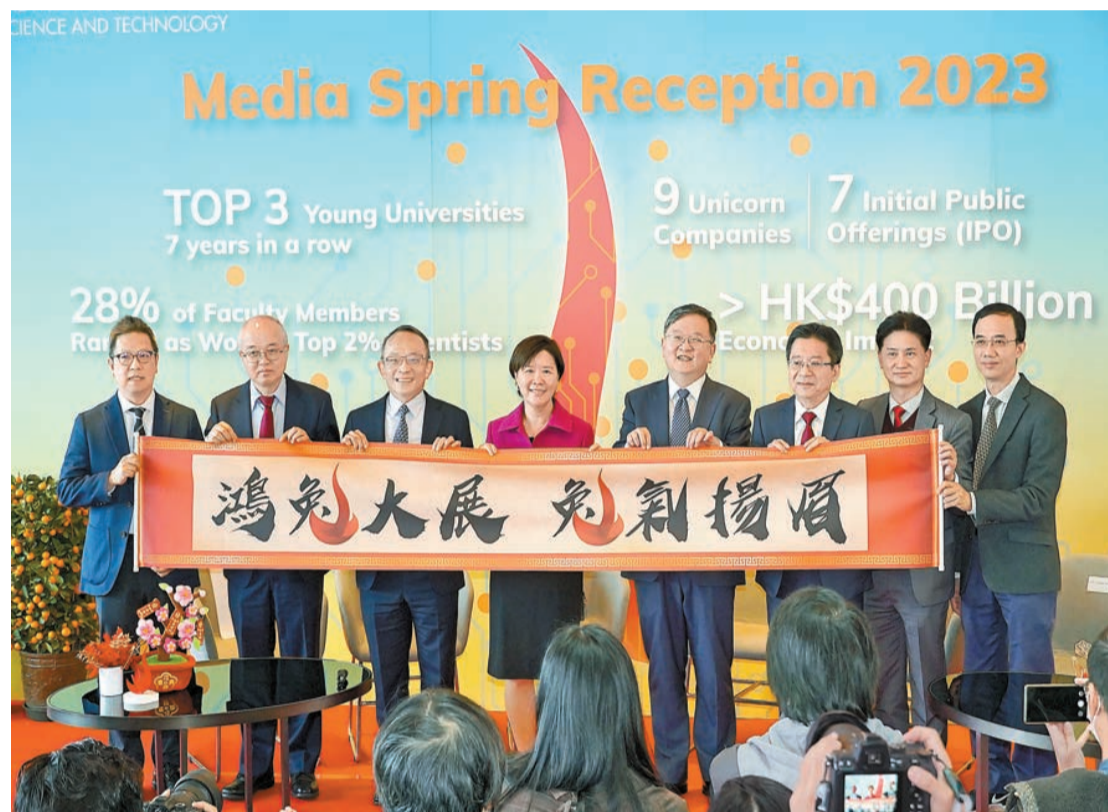
科大校長葉玉如(左四)昨表示，未來科大將在六大領軍重點領域，於全球招聘30名副教授或以上一流人才。

【香港商報訊】記者林駿強報道：創科發展愈來愈受到重視。科技大學校長葉玉如昨日表示，現時本港正遇上創科發展的黃金機遇，國家也非常支持香港成為國際創科中心，未來科大有三個發展方向，分別是提升創科實力、加速推動科研成果轉化落地、全球招聘和培養更多創科人才。她強調人才非常重要，可令創科行業持續發展，科大將在六大領軍重點領域於全球招聘30名副教授或以上一流人才。