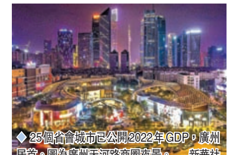
◆25個省會城市已公開2022年GDP，廣州居首。圖為廣州天河路商廈夜景。

這25個城市的GDP均實現正增長，其中12個城市的實際增速跑贏或持平全國3%平均增