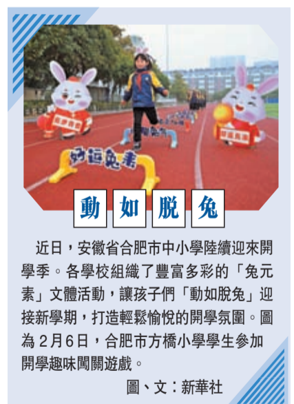
近日，安徽省合肥市中小學陸續迎來開學季。各學校組織了豐富多彩的「兔元素」文體活動，讓孩子們「動如脫兔」迎接新學期，打造輕鬆愉快的開學氛圍。圖為2月6日，合肥市方橋小學學生參加開學趣味闖關遊戲。圖、文：新華社

新學期開學前，多地學生都經歷了網課加寒假的「超長寒假」。多地教育部門要求，重視開學前後學生心理健康狀況。如福州市教育部門要求，分析疫情新形勢及長期居家情況下學生的思想心理變化趨勢，對可能出現的思想心理問題早研判、早預防、早干預。