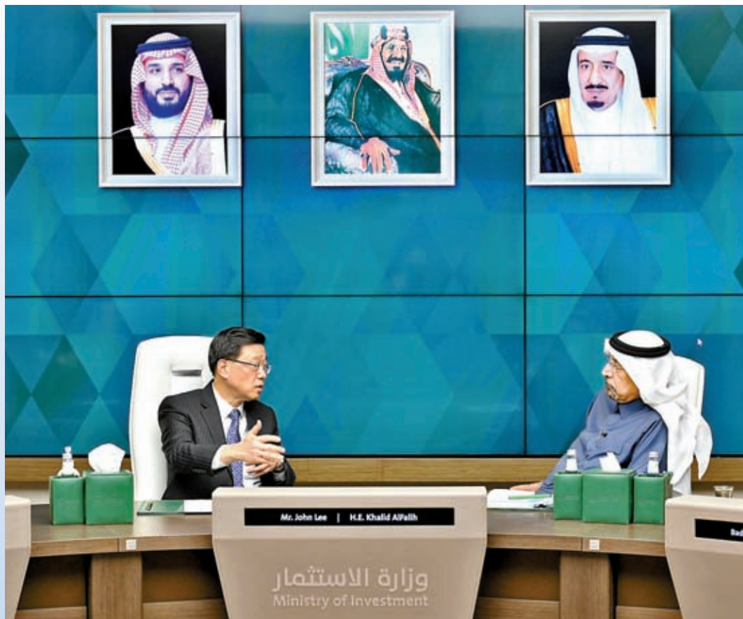
◆李家超與沙特阿拉伯投資大臣Khalid Al-Falih（右）會面。