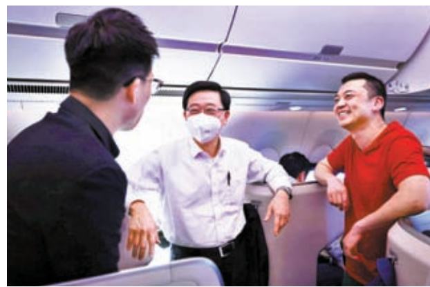
◆特首在飛機上與兩位年輕企業家閒談，了解他們的從商經驗。

丘應樺強調，沙特是香港在中東重要的合作夥伴，展開促進和保護投資協定談判，有助加強相互的投資保護。這亦將增加投資者信心和擴大兩地的投資流動，進一步鞏固雙方的經貿聯繫。