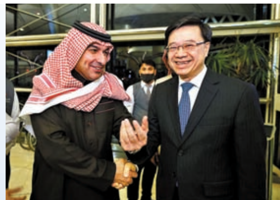
◆沙特阿拉伯投資部副大臣Badr AlBadr在機場迎接李家超。