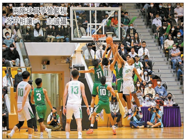
聖若瑟一眾師生、學生會後來張開水大合照。