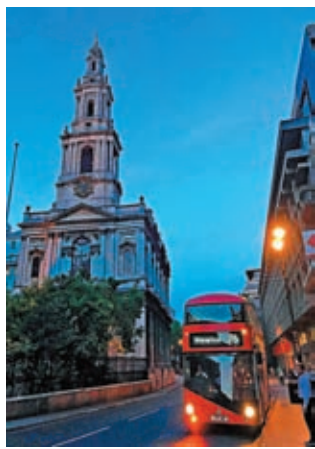
8月末，晚上8時30分倫敦街景。

相信「辦法總比問題多」。一個懂得解決問題的人，可將周遭的人視為貴人化為助力，遇事逢凶化吉，把不可能的事變為可能，達到自己的目的，創造奇跡，這是生存的力量！