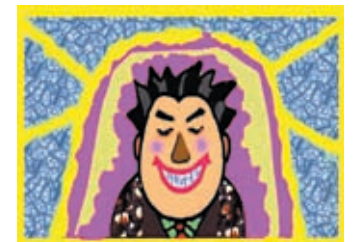
口甜舌滑者糖分再多也不可靠！

雖然平日烹飪也多習慣用糖調味，不過認識到糖的害處之後，我家「家廚」蒸魚不再下糖，發覺原來味更鮮美，可見習慣並不可靠。