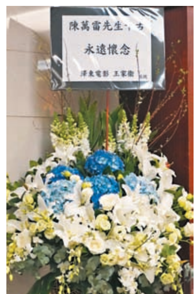
◆王家衛導演送上花圈向陳萬雷致哀。

差,12月20日確診新冠肺炎,3日後離世。她續指,父親原本經常穿梭兩地,在內地經營工廠及在港拍戲,但數年前拍畢電影《三夫》後,身體開始欠佳,加上腳腫,便退休留港居住,在其人生最後階段,4名子女都有相伴在旁,父親原想看到在內地讀書的孫兒慶祝16歲生日,其他就沒有什麼遺憾了。