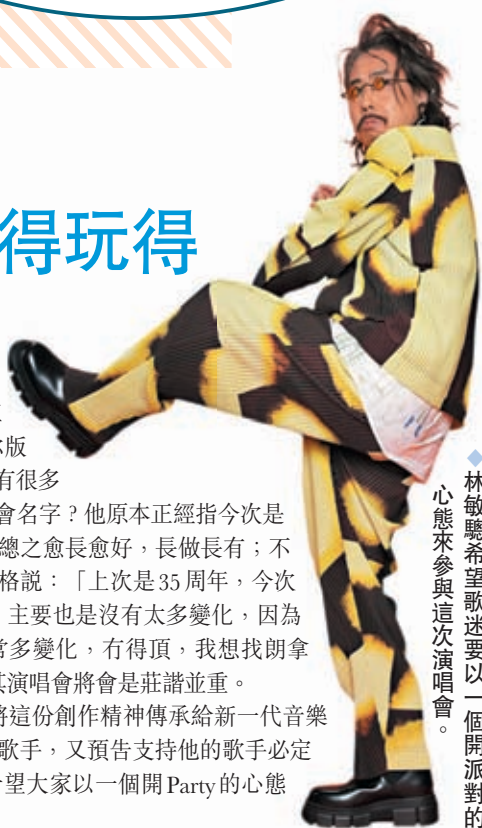
◆林敏驄希望歌迷要以一個開派對的心態來參與這次演唱會。

香港文匯報訊(記者子棠)林敏驄(聰哥)將於3月18日及19日於西九戶外舉行一連兩場演唱會,演唱會海報及拍攝海報照片的花絮片段1月31日曝光,拍攝期間聰哥共換了三套服裝及配上動作,海報上出現的十五個迷你版林敏驄亦非常貼合他無厘頭的風格。聰哥表示有很多朋友問他為何今次要改一個破紀錄字數的演唱會名字?他原本正經指今次是四十周年演唱會,所以至少也要有四十個字,總之愈長愈好,長做長有;不過提到演唱會嘉賓,聰哥又以拿手的無厘頭風格說:「上次是35周年,今次是40周年,相差了5年,樂壇也有很多變化,主要也是沒有太多變化,因為我不在,所以我現在在台上,分鐘會有非常多變化,有得頂,我想找朗拿度、美斯及C朗和我在台上Dig波!」披露了其演唱會將會是莊諧並重。