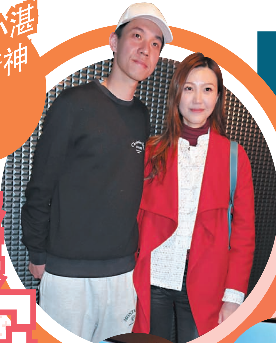
◆吳若希笑言要帶老公出來見面。