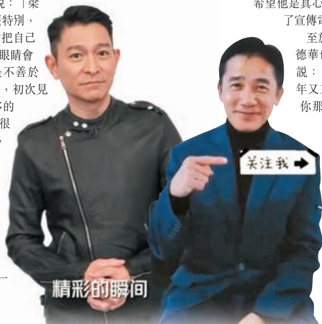
◆劉德華期待與梁朝偉互動。