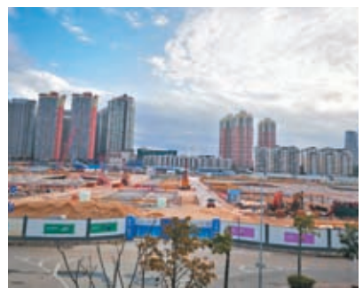
◆新皇崗口岸工地。

看,並沒有大量施工車輛在工作,十餘輛挖掘機停在工地內,只有一輛運土車和一輛灑水車在運作。