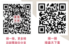
掃一掃，更多新聞內容請到本報APP

法國、意大利和英國是西班牙木屑顆粒的主要進口國，它們2022年都增加了從西班牙的進口量。2021年至2022年，西班牙出口到法國的木屑顆粒數量增長148%，而對意大利和英國出口量的增幅則較為溫和。新市場也已開辟，例如德國、比利時和瑞典，對這些市場的出口量均實現正增長。葡萄牙也呈現了類似的趨勢：該國從西班牙的進口量從2021年的1078噸上升至2022年的16587噸。（編譯/田策）