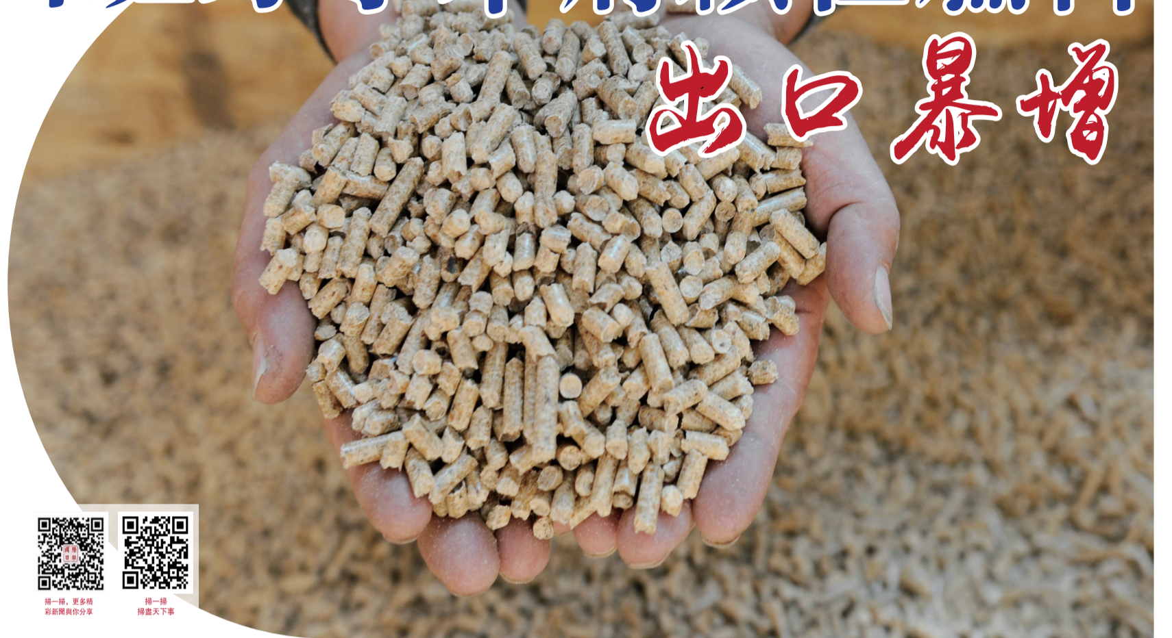
掃一掃，持續關注本報