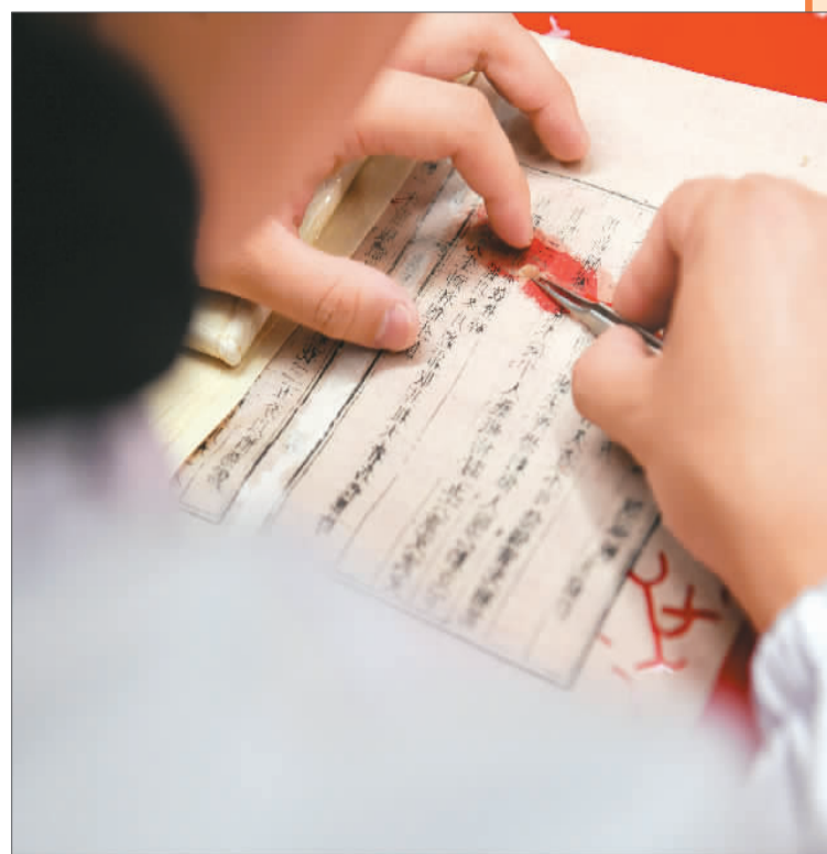
▲ 2022年10月20日,在安徽中医药大学图书馆古籍部,古籍修复师进行古籍修复。