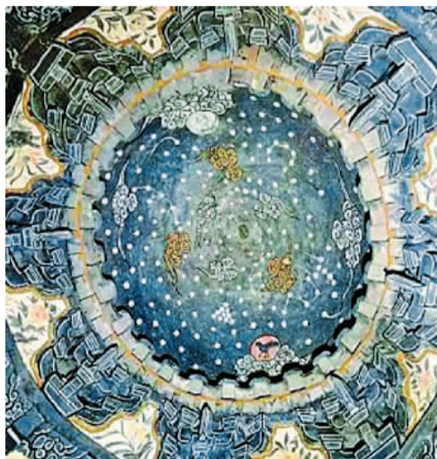
上图：山西省阳泉市高新区近日出土3座元代砖雕仿木构穹隆顶纪年壁画墓。墓室穹隆顶彩绘有三足金乌和兔子捣药以象征日、月，其余部位满布彩云及星辰彩画。专家表示，墓葬丰富的壁画内容为研究元代家具形制、服饰装扮及生活习俗等提供了直观认识。

这一发现为研究珠江口地区夏商时期考古学文化的年代序列，揭示先民的生产、生活的基本面貌，以及生态环境、动植物分布和物种构成等历史信息提供了重要的考古实物资料。