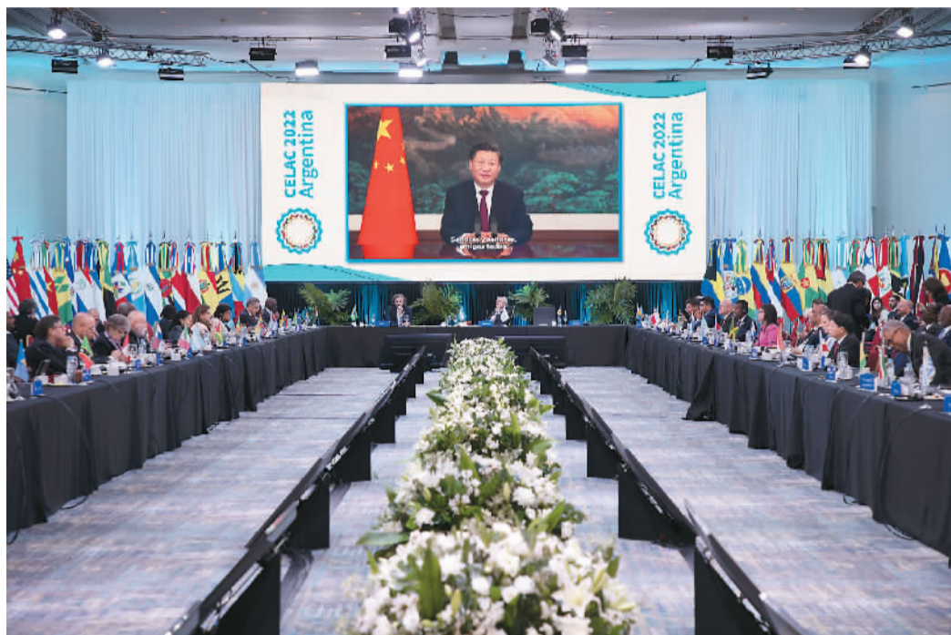
1月24日, 拉美和加勒比国家共同体第七届峰会在阿根廷首都布宜诺斯艾利斯举行。应拉共体轮值主席国阿根廷总统费尔南德斯邀请, 国家主席习近平向峰会作视频致辞。