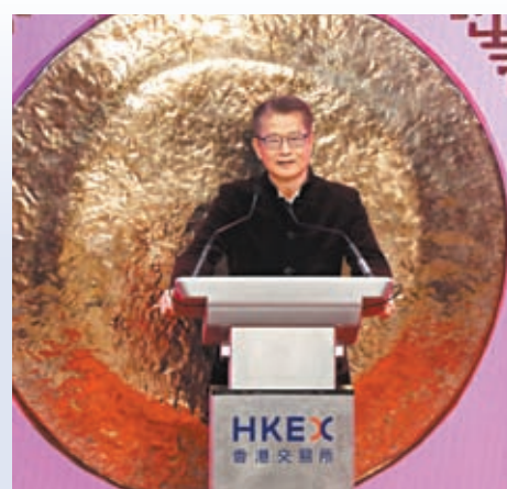
▲ 陳茂波表示，深信今年港股一定「兔氣揚眉、兔躍如飛」，跳上新台階，踏上新水平。