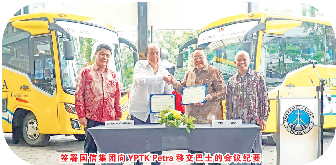
签署国信集团向YPTK Petra 移交巴士的会议纪要