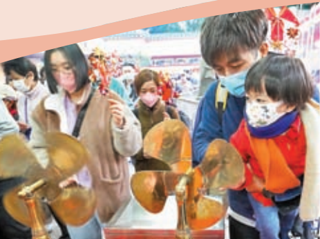
◆市民帶同子女拜車公。

雖然24日天氣轉冷，仍無阻大批善信趁「赤口」到車公廟拜車公，排隊人龍沿車公廟路兩旁延伸。華人廟宇委員會表示，24日截至下午5時半共有26,768人次進廟，較大年初二同期多約3,000人次。謝先生一家三代同堂逾40人約於上午10時抵達廟外，輪候了約一小時才能進場，較去年用多一倍時間。他表示，以往每年均會與家人到車公廟祈福，今年人流多了，氣氛亦更熾熱。由於一家三口曾於去年3月染疫，現時半歲大的細仔當時仍未出生，祈求今年全家身體健康，亦期盼「口罩令」盡快解除。