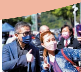
◆蕭澤頤與市民合照。