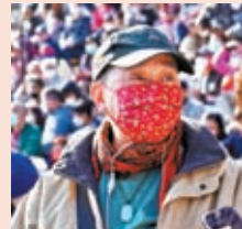
◆李先生投注數百港元贏了近三千港元。