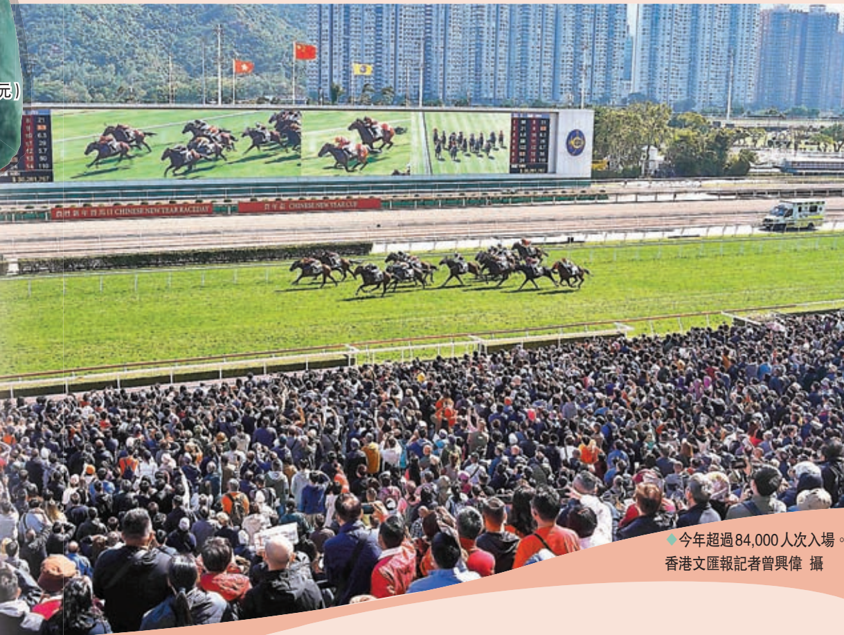
◆今年超過84,000人次入場。