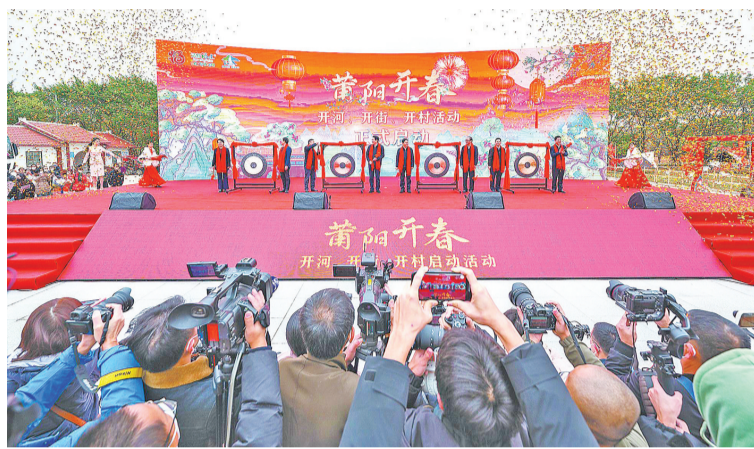
1月17日，“莆阳开春，开河、开街、开村”活动启动仪式在涵江区白塘湖公园玉兔广场举行。

和习近平总书记治理木兰溪的重要理念的具体举措，我们通过植入业态，激活价值，策划生成了一批景观“引爆点”，让老百姓在家门口就能领略壶山兰水画卷之美、感受穿梭千年悠悠古韵、体验岁月静好田园生活，尽享“诗和远方”的惬意。下一步，我们将以“莆阳开春”活动为切入点，联动发展1号滨海风景带，创建国家文化和旅游消费