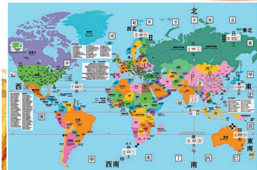
◆從千支曆看世界地圖，以最高點的喜馬拉雅山為中心點，中土（中國）為戊己，北方（俄羅斯）為壬癸，東方（日本）為甲乙，西方（美國）為庚辛。

國際陣營中美對壘仍激烈 除了俄羅斯，北方變成癸水，資源開始減少而無力，意向只望保住烏東。而乙木東方受癸水所生，東南亞包括香港將拾級而上。不過，己未月（七月）會有反覆，小心投資失利，因土剋水，影響經濟貿易發展。而戊土中國與庚金美國，仍會曲線暗地裏激烈較勁！而且，還會以陣營對壘模式，戊癸合中俄對庚乙美日韓較量。不過，癸卯年有望形勢有小逆轉，戊癸化火剋乙庚化金。加上，卯是戊的官星，而美國則仍擺盟主範乙庚合，乙的順從，包括陽奉陰違的歐洲、庚癸美國實則內外交困，鐵石心腸，繼續只顧自利！丙辰月（4月5日至5月5日）後，中國看高一線，惜2024年，拐點又到，又生變，無常也。於是，禪悟居士特地撰寫了一首詩作來年的預測：