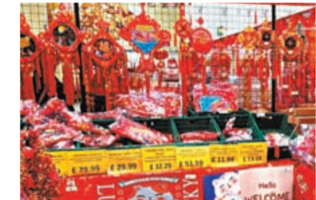
◆各種賀年裝飾應有盡有。