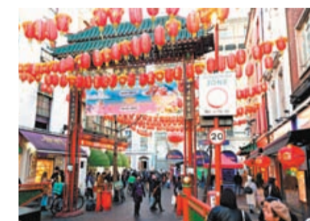
◆倫敦華埠掛滿燈籠。周天禧攝

主流商店供應大量價廉物美、應節的農曆新年商品，連帶一些折扣店也出售相關的裝飾品和其他物品，迎合普羅大眾的需要。超市與食肆的布置一片喜氣洋洋，傳統食品仍然吸引大量買家，其中糕點油器最受兒童歡迎。華人家庭保留團年傳統，酒樓生意可觀。