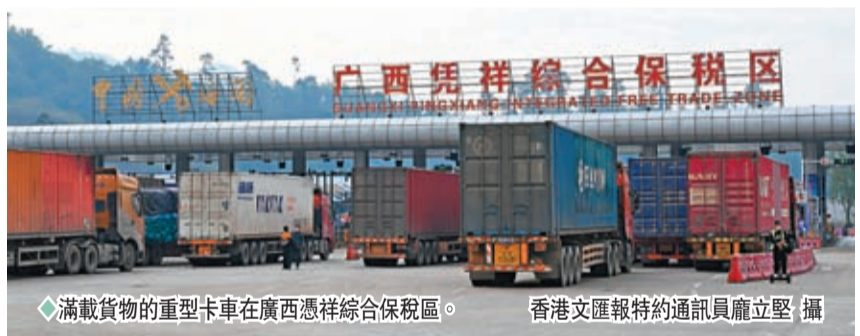
◆滿載貨物的重型卡車在廣西憑祥綜合保稅區。

「緬甸光照條件好，所產西瓜個頭大，味道甘甜，是每年春節水果市場的『寵兒』。」瑞麗市畹町長合商貿有限公司副經理徐紅元介紹，受疫情影響，前兩年的緬甸西瓜交易量有所減少。但今年，隨著口岸恢復正常通關，緬甸西瓜交易回暖。近期，長合水果交易市場緬甸西瓜日均交易量已達100多車，恢復至疫情