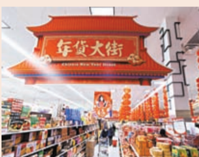
◆1月18日，顧客在加拿大多倫多一處超市的「年貨大街」購物。新華社

香港文匯報訊（特約記者成小智多倫多報導）加拿大是一個種族多元化國家，華裔人口達到177萬，但主流零售商家素來不重視農曆新年，直到今年情況才出現重大轉變，鑑於零售業預料今年上半年生意淡薄，大型連鎖零售商及知名企業剛踏入1月，已經鋪天蓋地宣傳農曆新年商品，而華人商場亦復辦停頓兩年的賀年活動，務求一網打盡各階層的華裔消費者。