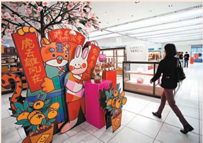
◆1月19日，在加拿大溫哥華，顧客經過百貨店內的春節主題裝飾。

貨種類愈加豐富。「通關政策調整之後，通關速率提高，鐵路貨物運輸量也有所上漲。」中國國家鐵路集團有限公司南寧局沿海鐵路公司欽州車務段欽州港東站站長黃江南表示，截至1月17日，今年西部陸海新通道鐵海聯運班列累計運輸貨物3.8萬標箱，同比增幅15.6%。據介紹，目前西部陸海新通道鐵海聯運班列線路已通達中國17省（自治區、直轄市）、60市、113站，相比2021年增加4省、13市、21站。