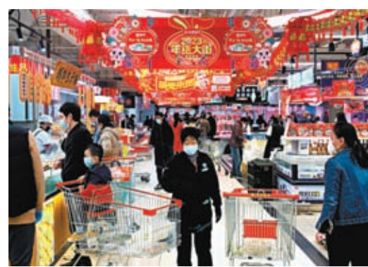
◆市場對內地今年消費預期更為樂觀。資料圖片

汪濤表示，該行預計今年第一季中國GDP同比增速將小幅放緩至2.4%，儘管其環比折年增長率可能回升至4%。第二季開始，環比增長勢頭有望大幅回