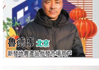
魯德傳 北京 新發地農產品批發市場商戶