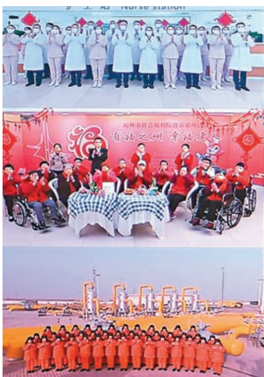
▲1月18日，中共中央總書記、國家主席、中央軍委主席習近平在北京通過視頻連線看望慰問基層幹部群眾，向全國各族人民致以新春的美好祝福（拼版照片）。

臨近春節，神州大地處處洋溢着節日的喜慶氣氛。1月18日上午，中共中央總書記、國家主席、中央軍委主席習近平通過視頻連線看望慰問基層幹部群眾，向全國各族人民致以新春的美好祝福，祝各族人民身體健康、闔家幸福、事業進步、兔年吉祥！祝願偉大祖國繁榮昌盛、國泰民安！在連線中，習近平數次強調農村地區防疫工作的重要性，要求補齊農村地區疫情防控的短板。在與四川北川羌族自治縣石椅村民眾連線時，習近平強調，疫情防控措施優化調整後，我最擔心的是農村和廣大農民朋友。農村醫療條件相對薄弱，防控難度大、任務重。要堅持像脫貧攻堅那樣，「五級書記」抓農村防控，縣鄉村三級尤其要承擔起屬地責任，強化返鄉務工人員和大中專學生防疫服務，加強農村老幼病殘孕等重點人群醫療保障，最大程度維護好農民群眾身體健康和正常生產生活秩序，確保群眾平安過年。中共中央政治局常委李強、蔡奇、丁薛祥陪同看望慰問。