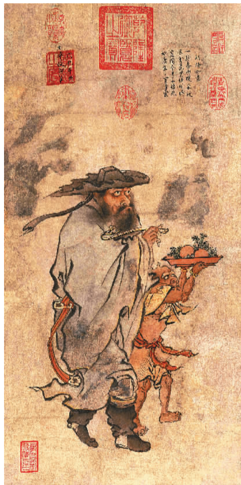
▲ 岁朝佳兆图 朱见深（明）