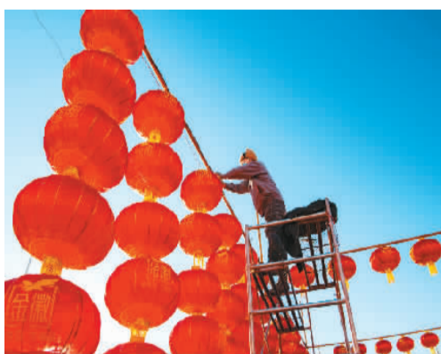
▲ 春节临近，甘肃省酒泉市阿克塞哈萨克族自治县街头，工人在悬挂红灯笼，喜迎佳节。

春节之红，是“礼”，是中国人的现实生活色彩应用在重要时间节点的典型表现。那些红灯笼、红对联、红包、红烛、红窗花，年复一年地强调着中国人的生活仪式，传递着文化的温度。