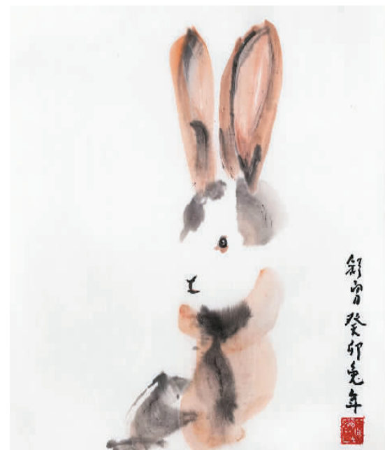
▲ 舒勇《兔》“飞猛进”主题系列国画作品之一