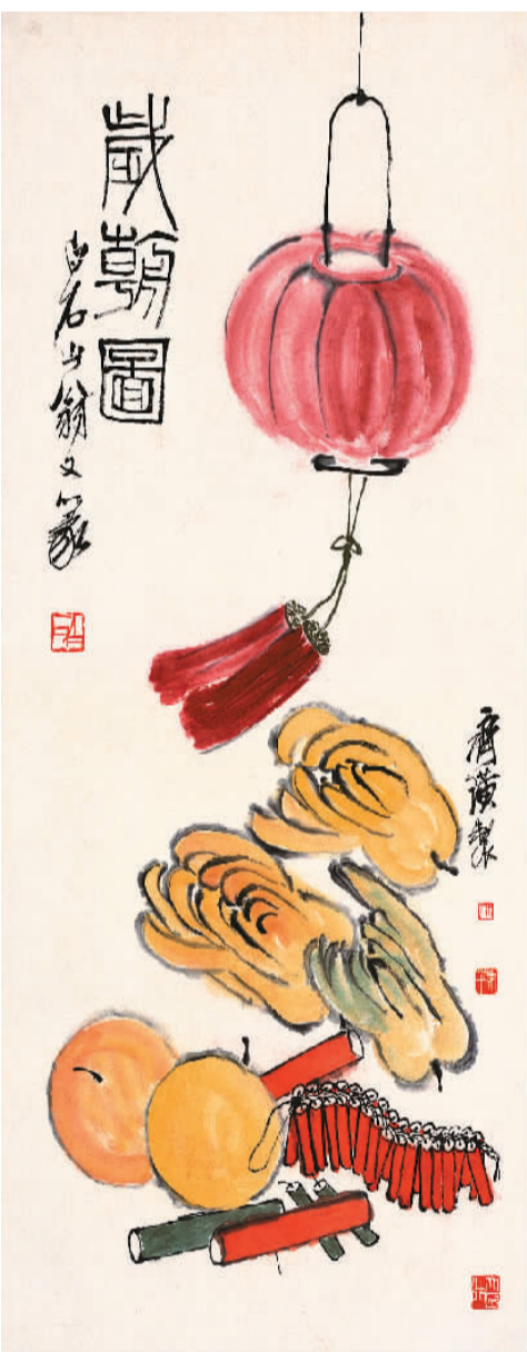
▲ 岁朝图 齐白石